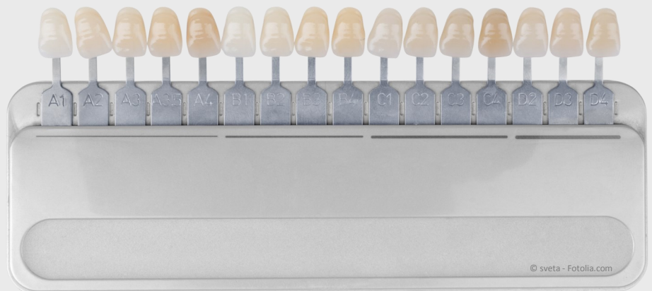
Farbskala zur Bleaching-Kontrolle

Wenn wir es machen, um mehrere Farbstufen . Das kann man ziemlich genau mit einer sog. Farbskala messen (siehe Foto). Frei verkäufliche Aufheller aus dem Internet oder Drogeriemarkt schaffen das meistens nicht.