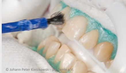
Power-Bleaching beim Zahnarzt: Auftragen des Bleaching-Gels

Wenn Sie die Praxis wieder verlassen, können Sie sich an sichtbar helleren Zähnen freuen!