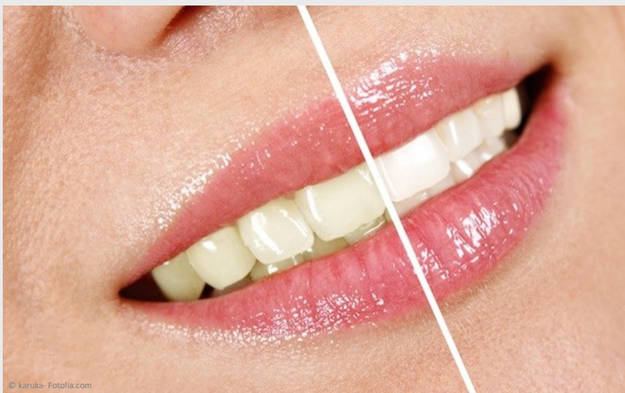
Deutlicher Unterschied: Professionelles Bleaching beim Zahnarzt wirkt!

Vertrauen Sie Ihre Zähne besser Profis an!